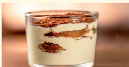
tiramisù 6,00 dolce al cucchiaino con biscotti* all'uovo inzuppati nel caffè decaffeinato, crema al mascarpone e cacao amaro