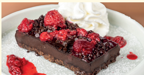
torta al cioccolato e lamponi 6,00 torta* al cioccolato con base crumble al cacao, servita con lamponi*, panna montata e zucchero a velo