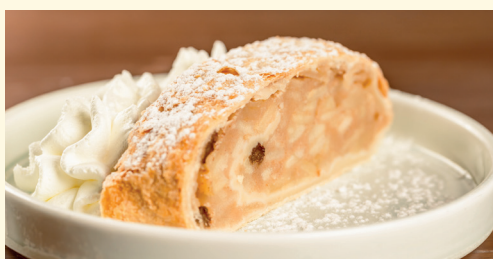
strudel di mele 6,00 strudel* di mele e uvetta, panna montata e zucchero a velo