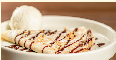
crêpe con Nutella® 5,50 crêpe* con Nutella®, granella di nocciole, topping al cioccolato, zucchero a velo e gelato al fiordilatte