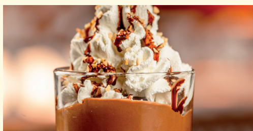
coppa choco 6,00 gelato al fiordilatte con Nutella®, granella di nocciole, panna montata e topping al cioccolato