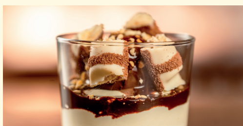
coppetta con kinder Bueno White® 5,00 crema al mascarpone, gelato al cioccolato, Kinder Bueno White®, topping al cioccolato e granella di nocciole