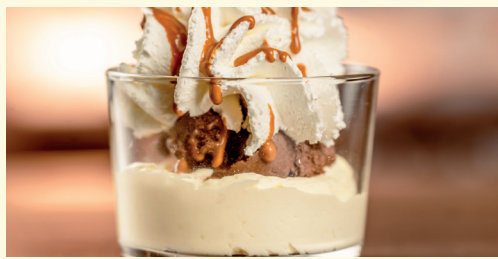
coppetta mascarpone 4,80 gelato al cioccolato, crema al mascarpone, panna montata e salsa al caramello salato