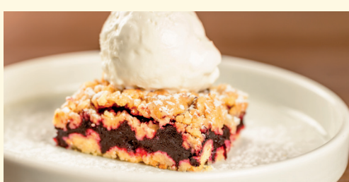
crumble ai mirtilli 6,00 torta* crumble ai mirtilli, gelato al fiordilatte e zucchero a velo