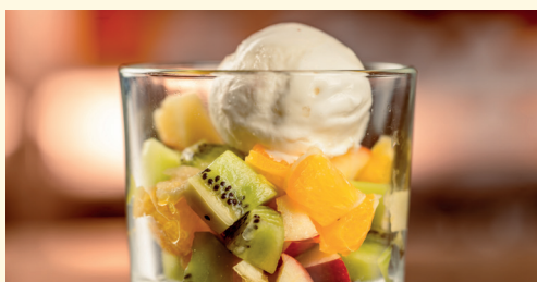
macedonia di frutta 3,50 con gelato al fiordilatte 4,80 macedonia di frutta di stagione con zucchero bianco e succo di limone