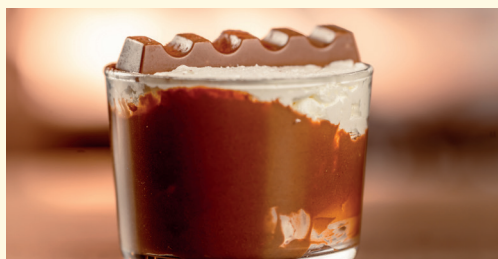
coppetta con Kinder Cioccolato® 4,80 gelato al cioccolato, Kinder Cioccolato®, Nutella®, panna montata e cacao amaro